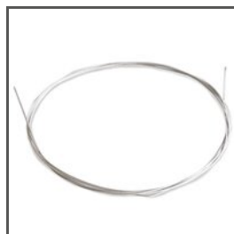
LINKA CU FI 0,95 mm Z70240