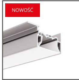
FOLED-50-SUF A03631 Ref. arch C3631