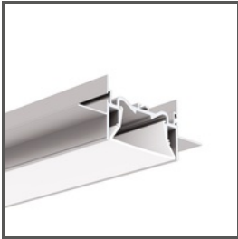
FOLED-50 A03632 Ref. arch C3632