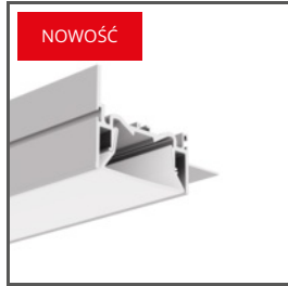
FOLED-50-BOK A0A57945 Ref. arch SA57945