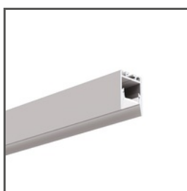
PDS-ZMG A01418 Ref. arch C1418