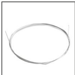
LINKA STALOWA FI-1 C24510N00