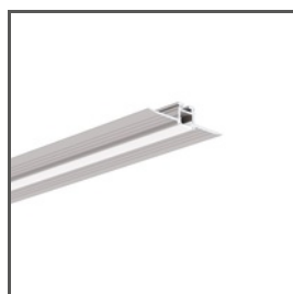
KOZEL-10 A01575 Ref. arch C1575