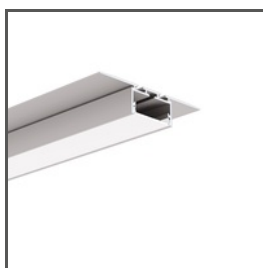
GIZA-LL-T A02479 Ref. arch C2479