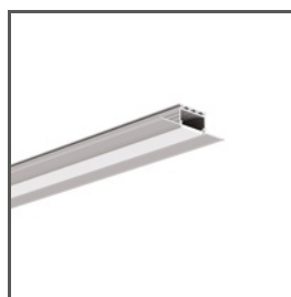
KOZUS A07823 Ref. arch B7823