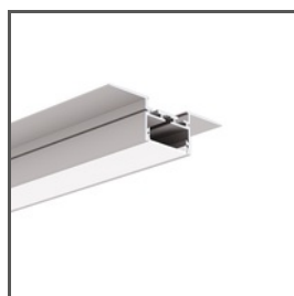
GIZA-LL-UST A02724N Ref. arch C2724