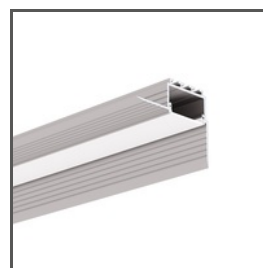
KOZUS-CR A00600 Ref. arch C0600