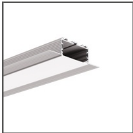
KOZEL-50 A00757 Ref. arch C0757