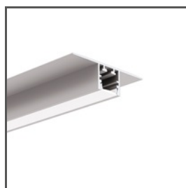
PDS-T A02057 Ref. arch C2057