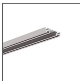
TEST-74 A04507 Ref. arch W4507