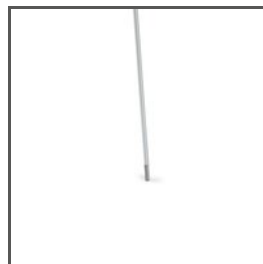
PRĘT PUSZ-ALU C28272A, C28272A07